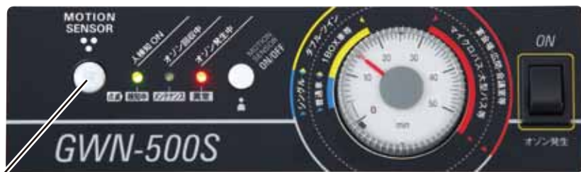
モーションセンサー

多数のユーザー様にご使用いただいている客室、車両での使用をよりわかりやすくしました。女性スタッフでも簡単に操作可能です。